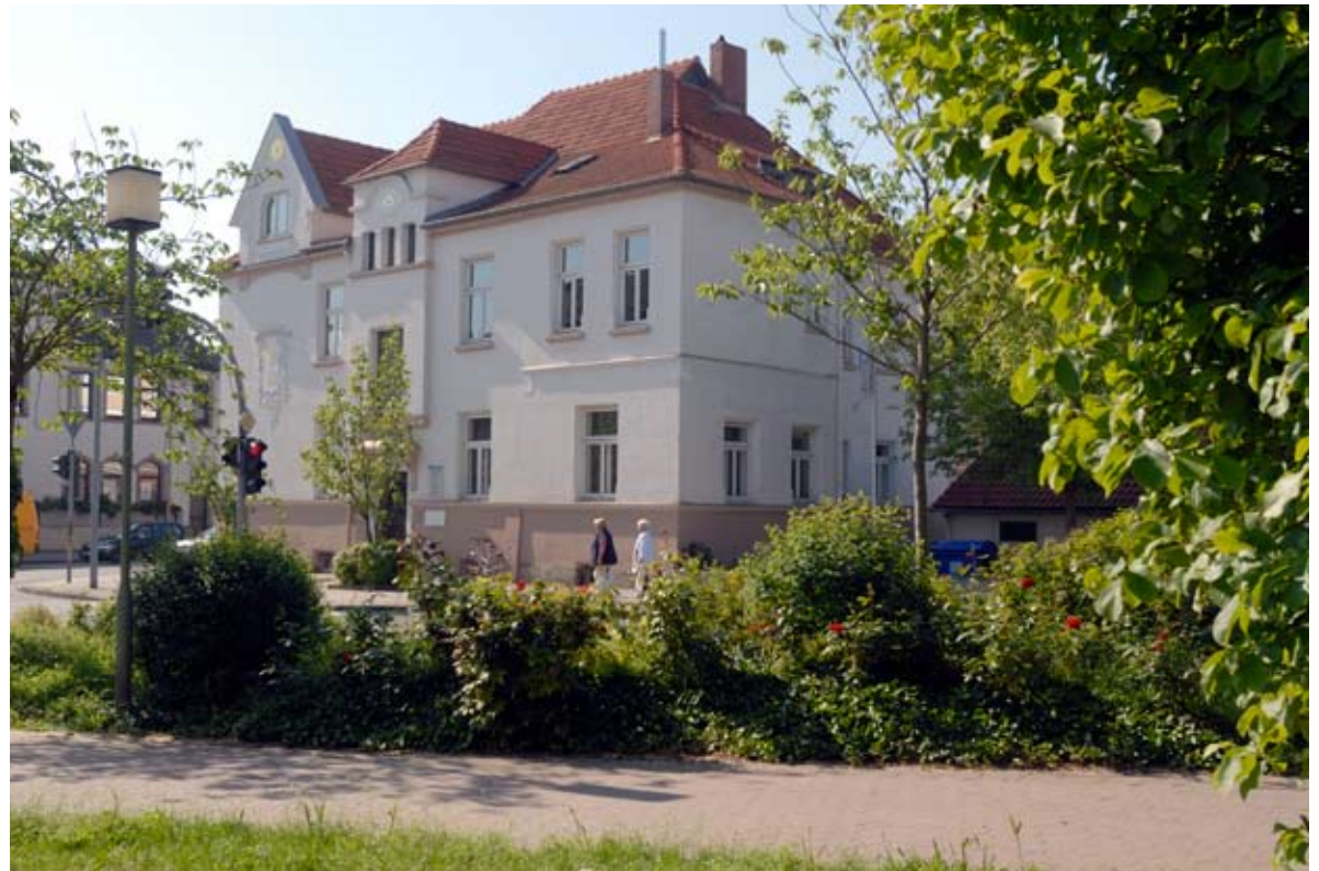
Haus der Diakonie in Helmstedt